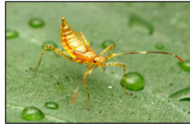
অপৈনত হেল'পিল'টিচে পাত শুহি আছে।

অপৈনত হেল'পেলটিচ দেখাত পৰুৱাৰ দৰে আৰু ইহঁতৰ বয়স অনুপাতে বৰণ তামবৰণীয়া, কমলা বৰণৰ বা সেউজীয়া হব পাৰে। ইহঁত সাধাৰণতে এটা কলিত বা কুমলীয়া পাতত ২-৩ টা কৈ লগ লাগি থাকে। বয়সীয়া