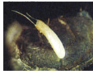
কণি বিলাক কোমল ঠাৰিৰ তলত থাকে

কলীবোৰ দীঘলীয়া আৰু বগা বৰণৰ হয়। সাধাৰণতে কুমলীয়া সেউজীয়া ঠাৰি বা পাতত হেল'পেলটিচ বোৰে কলি পাবে পাৰে। কলীবোৰৰ জোঙা অংশৰ পৰা দুডাল অসমাল স্তম্ভ ওলাই থাকে। বিবৰ্ধক কাঁচৰে চালে এই স্তম্ভবোৰ দেখাপোৱা যায়।